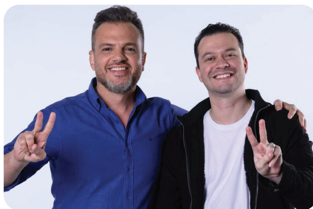
Jovem liderança do governo Boigues vira novo player político da região

As entrevistas estão disponíveis no portal aguardiadanoticia.com.br .